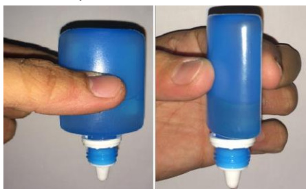
Fig.1 – Modelo de apreensão “em pinça” do frasco de colírio.

Quatro voluntários saudáveis, com idade entre 21 e 29 anos (média de 25,7 \sigma = 5,6 anos), sendo 1 homem e 3 mulheres, participaram do estudo que consistiu em pesar 5 gotas de cinco colírios lubrificantes de fabricantes diferentes utilizando uma balança de precisão calibrada – marca Bioprecisa Electronic Balance FA2104N, com resolução de 10 -4 g. Cada gota foi gerada posicionando-se o tubo de colírio perpendicular à balança e de forma que a pressão no tubo fosse aplicada com os dedos polegar e indicador no meio do frasco, como na Fig. 1. Os dados obtidos estão dispostos na Tabela 1.